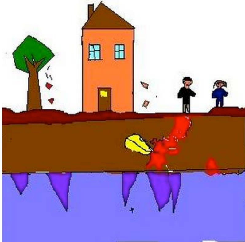
Fig. 5 – Cosa genera una scossa sismica? “Sottoterra c’è un drago che si chiama Conghi, che quando è nervoso provoca il terremoto”.

A questo punto si è proceduto in una duplice direzione. La prima è consistita nell’uso del noto paragone con l’uovo sodo per mostrare la struttura del pianeta e la differenza tra crosta, mantello e nucleo: si è utilizzato il racconto di Michela Candi, Il mistero dell’uovo sodo . La seconda, andando al di là del paragone con l’uovo, ha comportato l’uso di immagini dinamiche secondo una precisa progressione per fornire un ulteriore approfondimento di quanto spiegato e procedere nella direzione dell’educazione alla prevenzione. In tal senso un primo livello di uso è dato dalla conoscenza della tettonica delle placche, usando un video già sopra segnalato a cui è stato affiancato, anche con funzione di verifica, un gioco, basato su un semplice drag and drop , disponibile online . Un secondo livello è legato a spiegare in che cosa consiste il terremoto e nell’introdurre i primi aspetti legati alla prevenzione: in tal senso sono state utilizzate come risorse, già in parte sopra ricordate, due animazioni – Terremoto cos’è e cosa lo causa e What Is An Earthquake? – a cui è stata affiancata una simulazione per meglio comprendere il concetto di magnitudo e la scala Mercalli e Richter. Infine un terzo livello è stato finalizzato alla prevenzione usando anche qui due animazioni già segnalate, Tales of Disasters 2. Earthquake e Civilino e il terremoto , a cui si è aggiunto Earthquake Safety Song , una breve file audio in lingua.