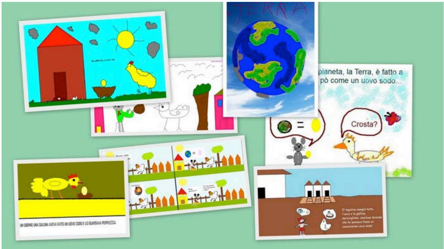
Fig. 6 – L'uovo sodo.

Il terzo livello, proprio perché di particolare importanza in una regione ad alto rischio sismico, è stato particolarmente curato cercando di rendere consapevoli i bambini delle situazioni di pericolo e dei comportamenti corretti da adottare. In tale prospettiva, oltre ad usufruire di prodotti multimediali, è stata promossa, in modo del tutto particolare, una partecipazione attiva, con l'elaborazione e la lettura di testi personali e collettivi, con la realizzazione di un alfabetiere della sicurezza, con la produzione di materiali finalizzati al consolidamento delle conoscenze indispensabili alla prevenzione.