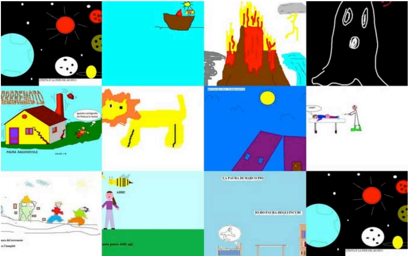
Fig. 1 – I disegni relativi alle paure.

Attività di produzione linguistica, realizzate con modalità ludiche e creative, come, ad esempio, filastrocche e acrostici, associate all'uso del brainstorming , hanno permesso un ulteriore approfondimento del tema. L'uso di nuvole realizzate con Wordle ha consentito una ripresa di quanto fatto.