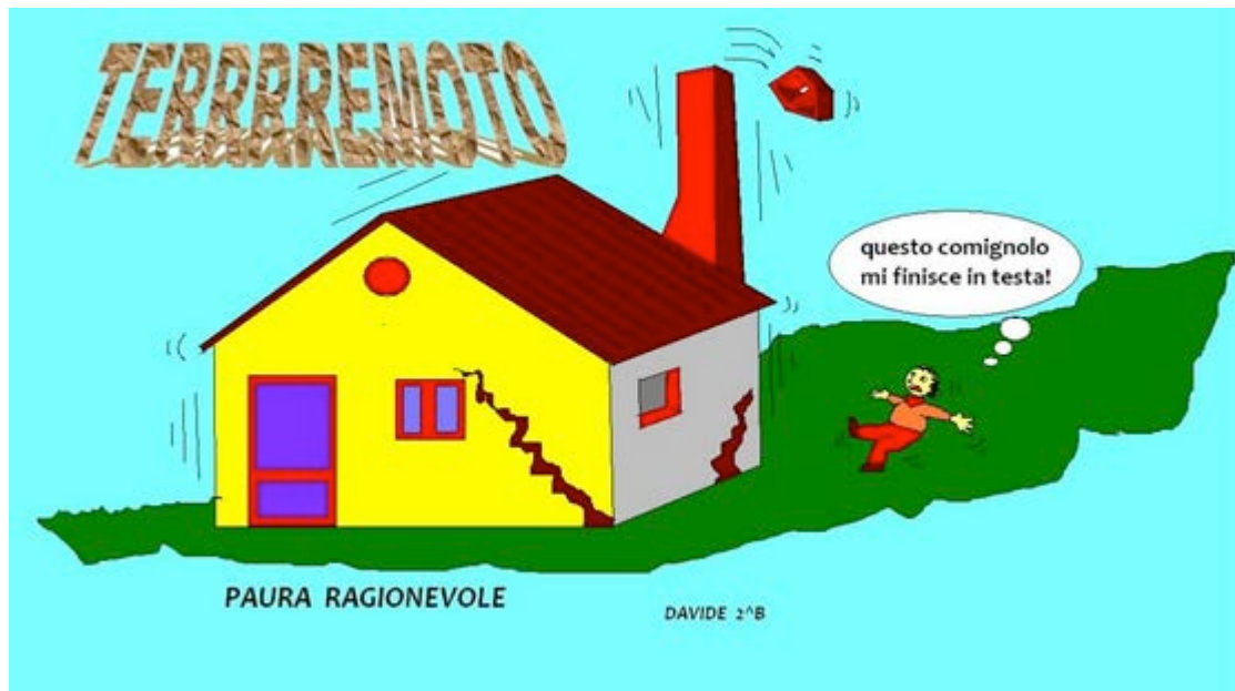
Fig. 3 – Il terremoto paura ragionevole

Analizzando i lavori degli alunni, sono emersi con evidenza alcuni termini che rinviano ai grandi rischi: terremoto, vulcani, calamità, inondazioni. Questo ha dato modo di portare l'attenzione, partendo dal tema molto sentito della paura, sul rischio sismico sottolineando come non tutte le paure sono irrazionali e come per certi territori il terremoto rappresenti una reale minaccia.