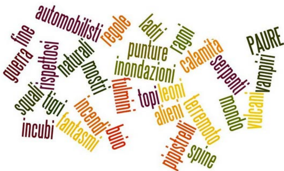
Fig. 2 – La nuvola relativa alle paure.

Attività di produzione linguistica, realizzate con modalità ludiche e creative, come, ad esempio, filastrocche e acrostici, associate all'uso del brainstorming , hanno permesso un ulteriore approfondimento del tema. L'uso di nuvole realizzate con Wordle ha consentito una ripresa di quanto fatto.